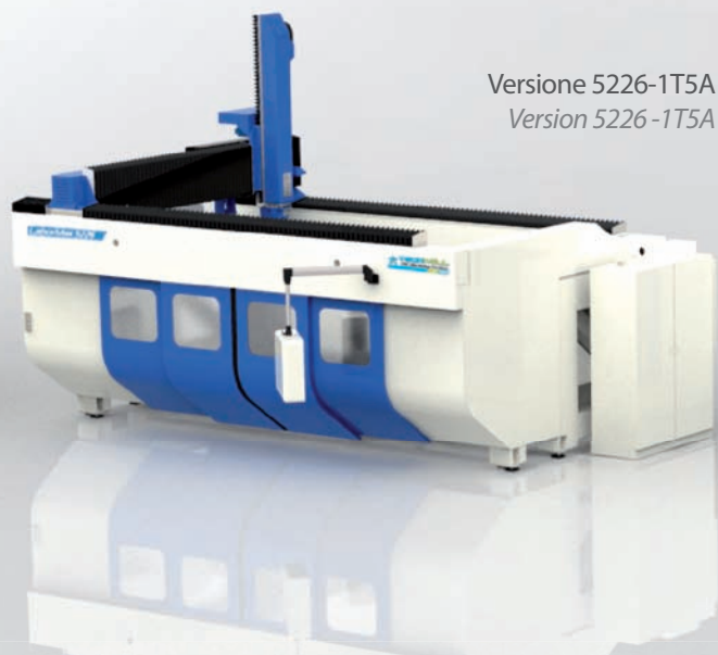
Versione 5226-1T5A Version 5226 -1T5A