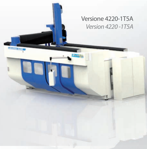
Versione 4220-1T5A Version 4220-1T5A

LaborMax is available in different versions, thanks to the customization possibilities of working tables, spindle power in addition to the comprehensive range of devices and accessories to always accomplish to meet any specific customer's production needs.